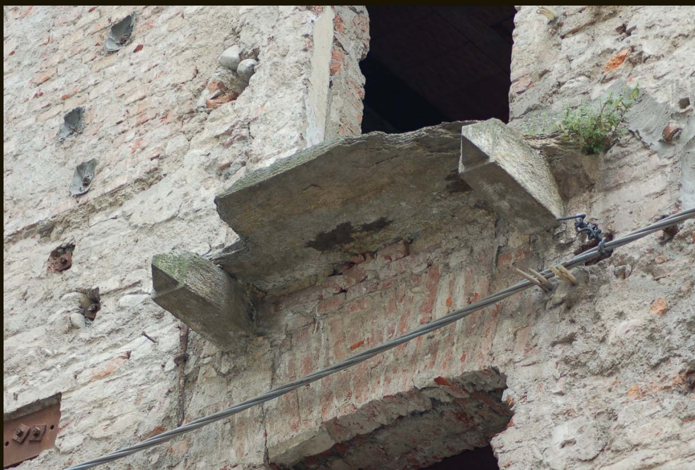
porzioni di fabbricato oggetto di intervento lungo via Bellezia angolo con via Santa Chiara nel quadrilatero Romano