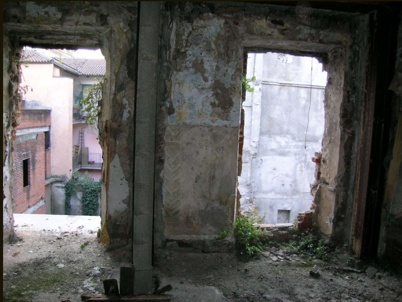
Puntellamenti strutturali provvisori per rinforzi temporanei di porzioni pericolanti