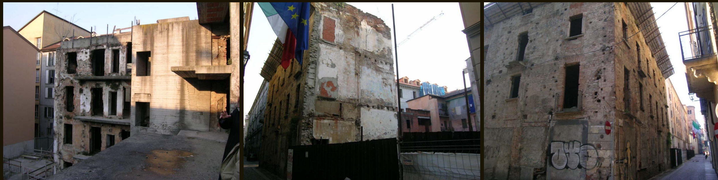
Ruderi supersiti in stato di alto degrado e interventi incompiuti degli anni '80